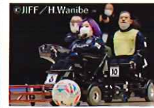
・電動車椅子サッカー