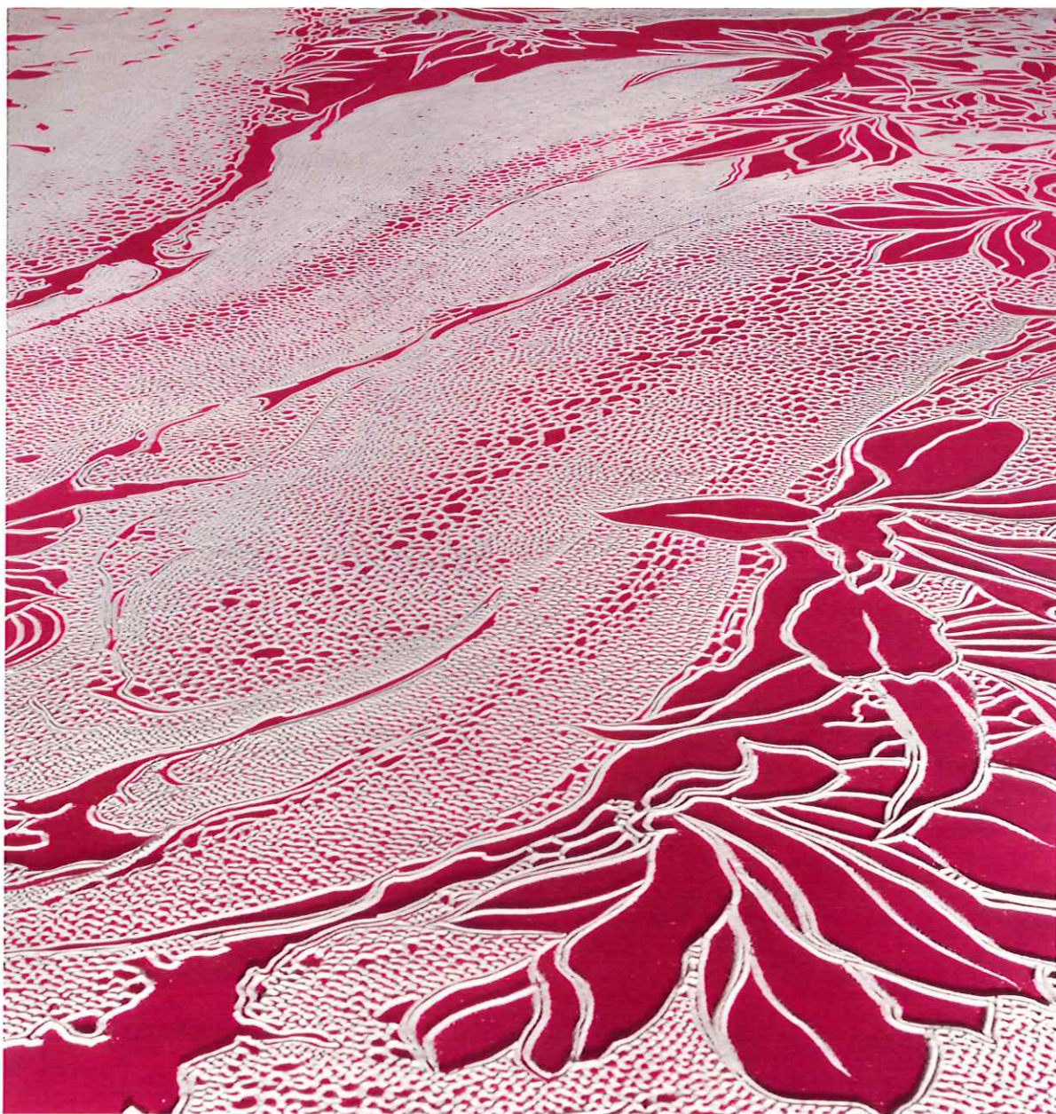
© 2018 Motoi Yamamoto / 東アジア文化都市2018金沢「変容する家」

51st International Home Care and Rehabilitation Exhibition