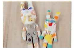
・ぬいぐるみ作り