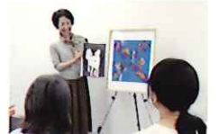
・対話型アート鑑賞

障害者就労支援施設での作業風景がそのままH.C.R.会場に再現。作品を見て、さわって、制作体験できます!